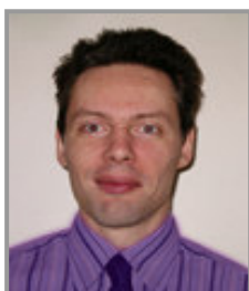
Candidat télévendeur après transformations binaires

Notre premier candidat télévendeur ne subira au départ que des transformations binaires sur les teintes de sa tenue vestimentaire pour la différencier avec celle du candidat avec surcharge pondérale. Il s'agit de notre premier candidat télévendeur sans surcharge pondérale.