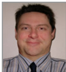
Candidat télévendeur Caractéristique : surcharge pondérale

On obtient après transformation la photo suivante :