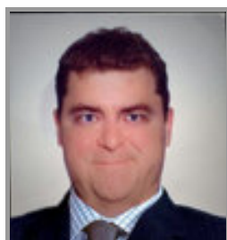
Candidat commercial N°2 après transformation informatique

On obtient après transformation informatique la photo suivante :